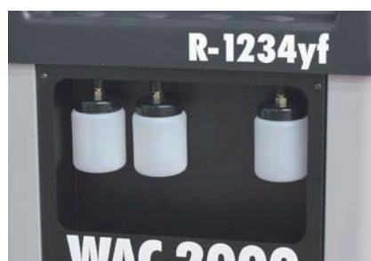
3 olajtartály - új, használt és UV olajhoz