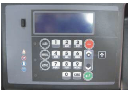
Egyszerű, letisztult megjelenésű kezelő